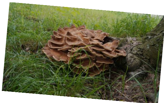
links: Biefstukzwam, dennenmoorder, reuzenzwam Marijke Niquet