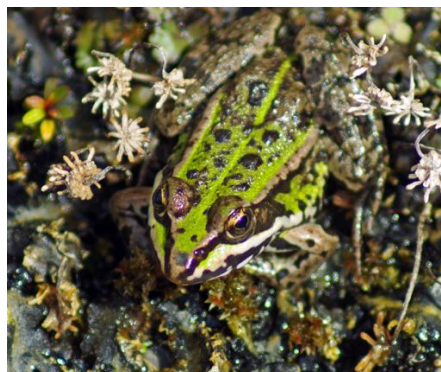
Kikker en peen

De webversie van de NHT is ontdaan van persoons-informatie.