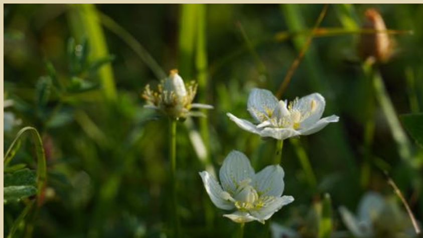
Fotografen op (de) pad(en)