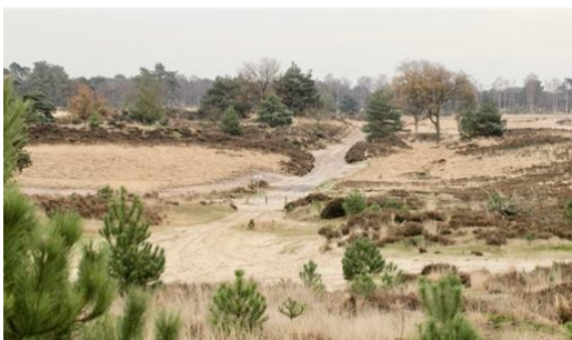
Kriekelare Duinen

Datum: Zondag 1 oktober 2023 Gebied: Kriekelare Duinen Thema: Open zand, gebied in ontwikkeling Tijd vertrek bij de Lodge: 8.30 uur Tijd vertrek ter plaatse: 9.00 uur Verzamelen: Recreatiecentrum Hazeduinen, 1e Verdelingsweg 6, 4645RT Putte Uw gids: Guus Dekkers Meereisbijdrage: € 5,-