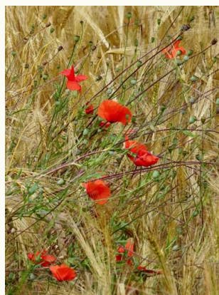
Links: Tarwe Rechts: Klaprozen tussen gerst

Een grote verbetering die werd geselecteerd door deze eerste boeren was de taaie aarspil. Wilde Eenekoren valt gemakkelijk uit elkaar door een brosse aar. Dit is voor een wilde grassoort voordelig vanwege de verspreidingsmogelijkheden. Gecultiveerde Eenekoren kan in het geheel worden geoogst door de selectie van een taaie, niet uit elkaar vallende aar. Vaak wordt het diploïde (2n) genoom van Eenekoren AA genoemd.