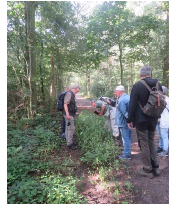
Waterpeper op het pad

Het valt op dat er steeds atalanta's op de schors van eiken neerstrijken. Het zijn mooie verse exemplaren. Wat doen ze daar? Ze zitten in de zon, maar ook in de schaduw, dus opwarmen zal niet (het enige) doel zijn. Vinden ze er voedsel? Binnenkort zullen ze gaan trekken; zuidwaarts of noordwaarts.