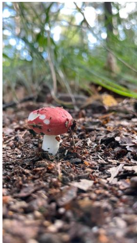
rechts: een russula - Frank Visch