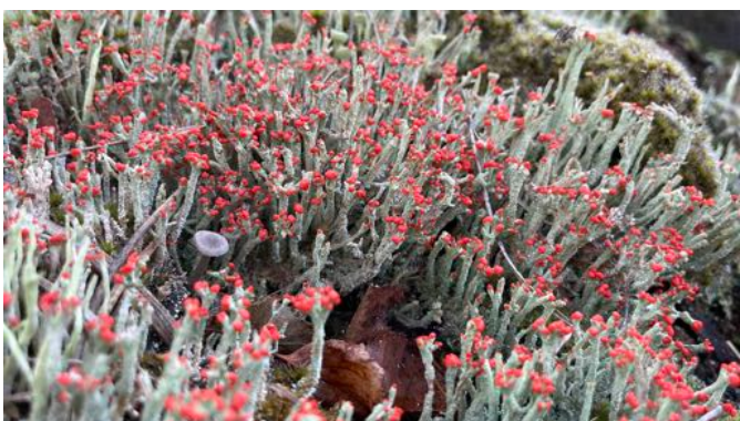
links: Ploioirokmycena met mest en rode heidelucifer - Frank Visch