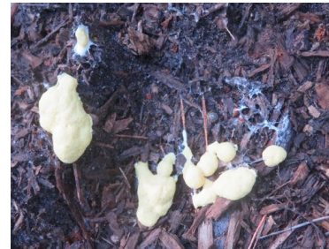
Hekstenboter - rechter foto: de kleur is eigenlijk meer gifgeel

We lopen op de open vlakte met stuifzand en heide. Planten die het zand bij elkaar houden zijn onder meer buntgras (grijzige pollens) en zandzegge. Zandzegge heeft ondergronds een meterslange, kruipende wortelstok, een soort dikke draad, die op regelmatige afstand polletjes vormt. Jack P. Thijsse noemde dit plantje 'Gods naaimachientje'.