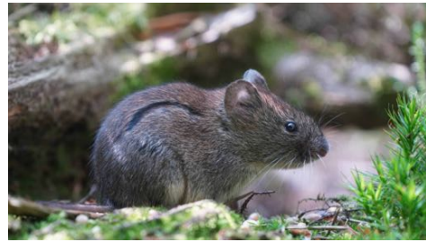
Woelmuis, M. Niquet